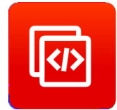
增强型 AT 命令集